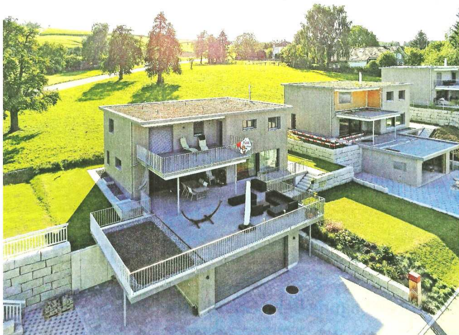
Attraktiv und baubiologisch gesund – die Einfamilienhaussiedlung im Oberen Zelgli, Fahrwangen.

Fahrwangen als Hauptstandort der Regionalschule und mit rund 30 Vereinen bietet beste Möglichkeiten, sich im schönen Seetal als Familie oder Paar rasch wohlfühlen. Die wundervolle